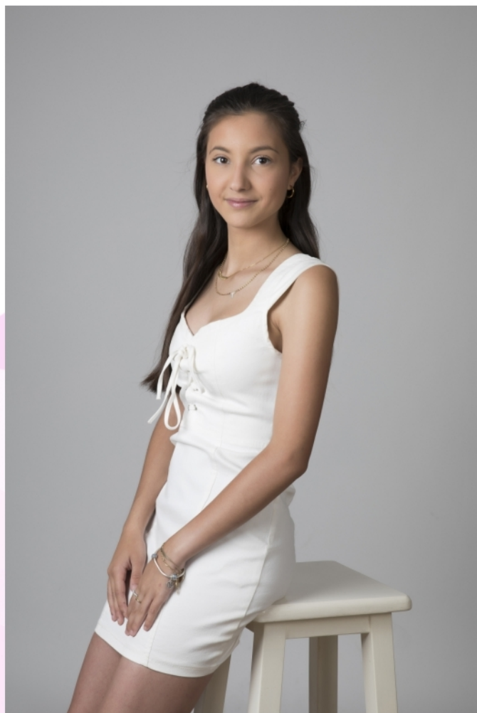
Reina de las Fiestas